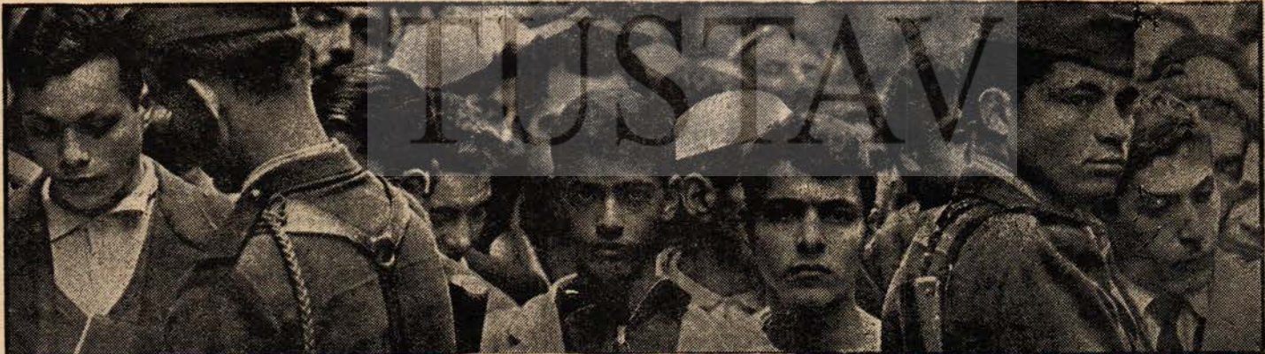
Cezayirliler bağımsızlık savaşında

ğerlidir ki, gerekseydi çok daha yüksek bir fiyat da ödenebilirdi ve Cezayir milleti de bunu ödemekten kaçınmazdı. Cezayirlilerin acılarını ve fedakârlıklarını, şu andaki sevinç duygularını, pek az millet biz Türkler kadar anlayıp takdir edebilir. Onların bu büyük gündeki saadet ve sevinçlerini yürekten paylaşmamak bizler için imkânsızdır.